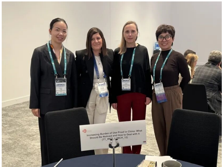
会议期间，万慧达知识产权租用多间会议室，与客户进行深入交流。