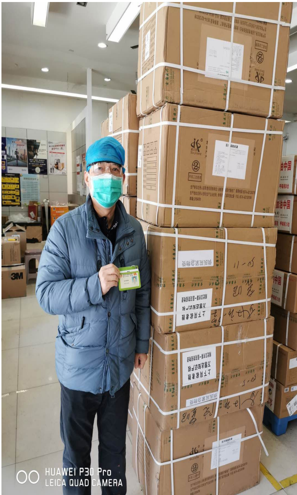
(图二：第二批捐赠物资)